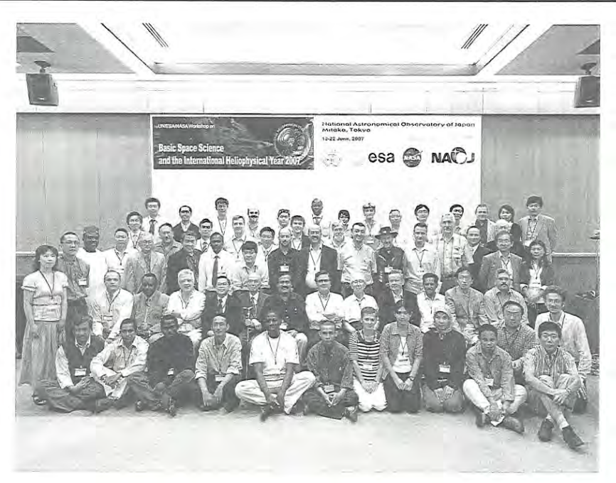
写真1 日本の国立天文台が主催者となった国際太陽物理年2007 (IHY2007) および基礎宇宙科学に関するUN/ ESA/NASA/JAXA ワークショップ (国立天文台・三鷹).

和利用(COPUOS)に関する国連総会の委員会構成国に日本が望遠鏡とプラネタリウムを供与するプログラムについて報告したときでもあった.北村教授の努力により、最終的に七つの望遠鏡、20個のプラネタリウムが発展途上国に供与された.このことは国連総会資料A/AC.105/902に記録されている.この書類には、2007年に日本の国立天文台が主催者となった国際太陽物理年2007(IHY2007)および基礎宇宙科学に関するUN/ESA/NASA/JAXAワークショップの詳細も書かれている(写真参照).日本がこのワークショップを主催することについては、1996年スリランカのアーサーC.クラークセンターでの天体望遠鏡設備の落成式の際にUNBSSIワークショップにおいて非公式に議論されていた.